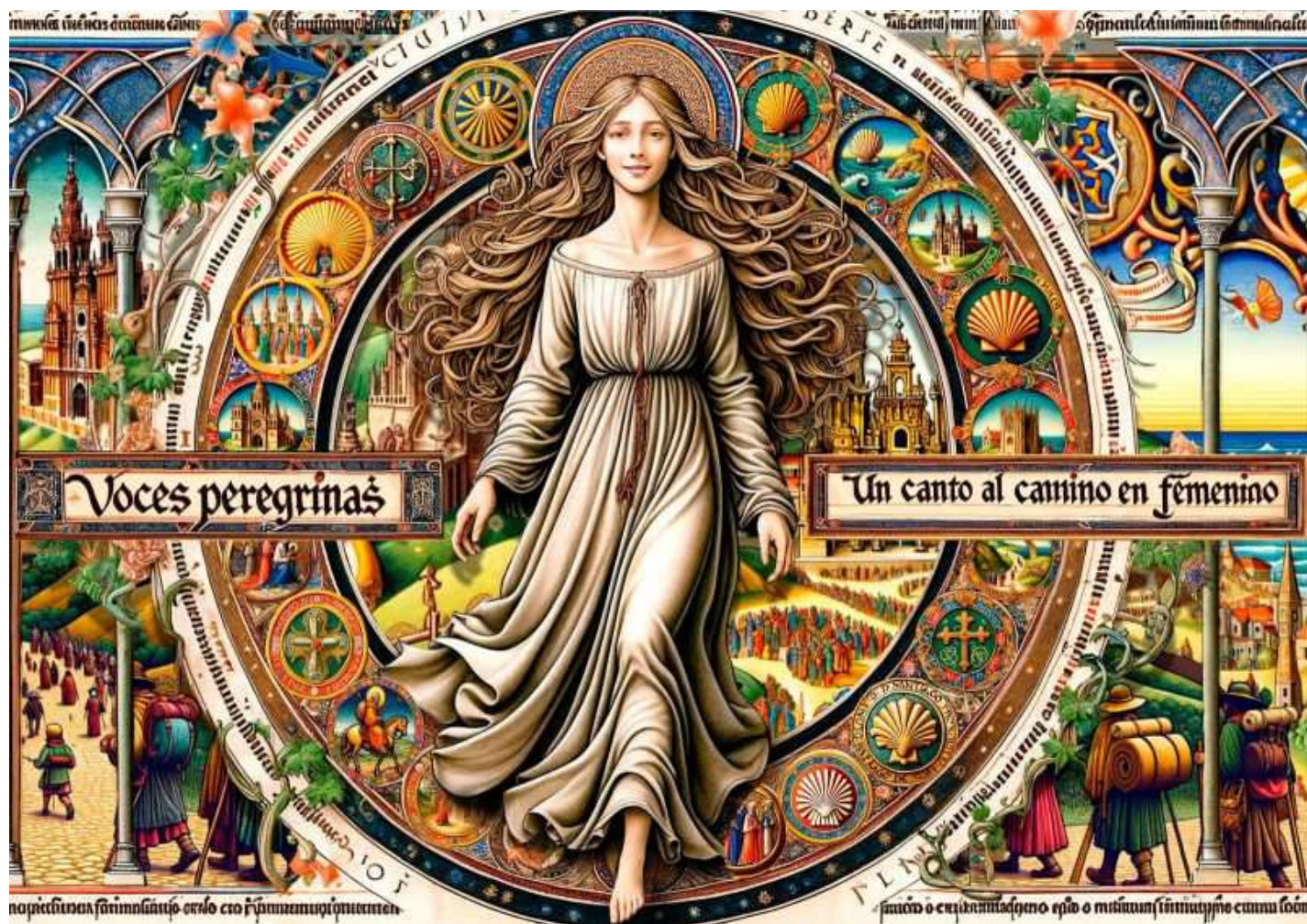
Portada del libro «Voces Peregrinas. Un canto al Camino en femenino».

No nos cansamos de pregonar, aunque a veces con la sensación de hacerlo en el desierto, que la gran revolución contemporánea del Camino de Santiago es el protagonismo que han cobrado las mujeres , las peregrinas. Desde 2018, salvo los dos años de pandemia, van superando ligera pero imparablemente en número a los varones, y a la vez desterrando para siempre esa imagen reiterada del peregrino barbado, un icono que hemos de relegar definitivamente al ayer.