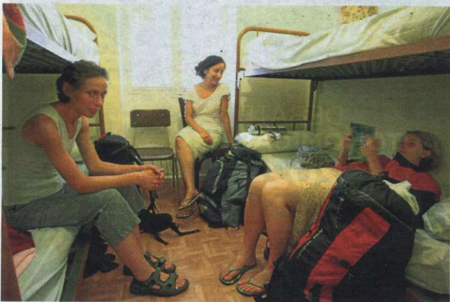
Parte de la villa Beti Guria de la calle Lucas de Berroa, posteriormente derribada, acogió el primer albergue de 2004 a 2006, con sólo diez plazas de pernocta.