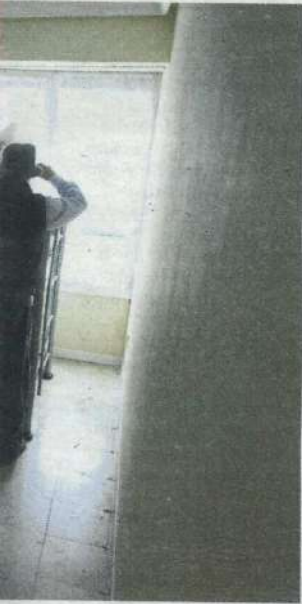
segunda. Un piso y luego un F. DE LA HERA