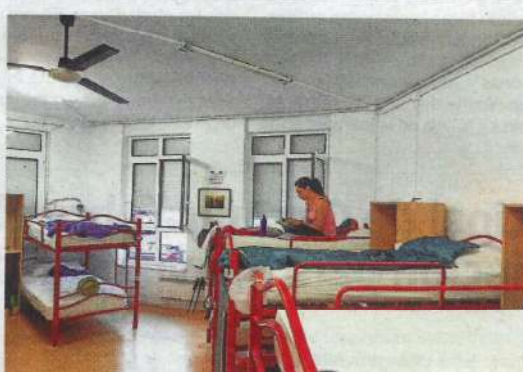
Una peregrina italiana estudia su guía sobre el Camino

mente nos dan sus perfiles de redes sociales, pero no vuelves a saber más de la gente que pasa por aquí. Es normal. Por el camino pasas por muchos albergues. Pero a veces hay circunstancias particulares y la de estos dos es un ejemplo, porque como se conocieron aquí quisieron contaros que habían llegado juntos.