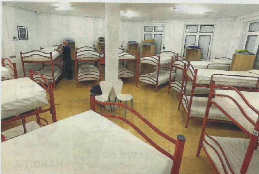
En 2018 se abrió la tercera ubicación del albergue irunés en el parvulario de El Pinar. Debidamente reacondicionado por la asociación Jacobi ofrece múltiples servicios y cuenta con con 60 camas.

planes urbanísticos en la zona, pero la experiencia de tres años allí, con medios limitadísimos y sólo 10 camas, demostró que la del albergue era una idea feliz.