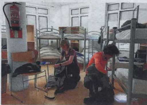
Dos mujeres alemanas se preparan para la pernocta.