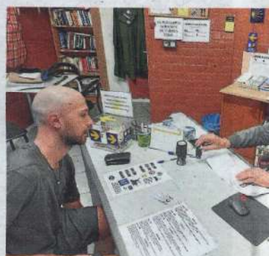
Acogida a un peregrino de República Checa.

marcha para ver exactamente cómo vamos».